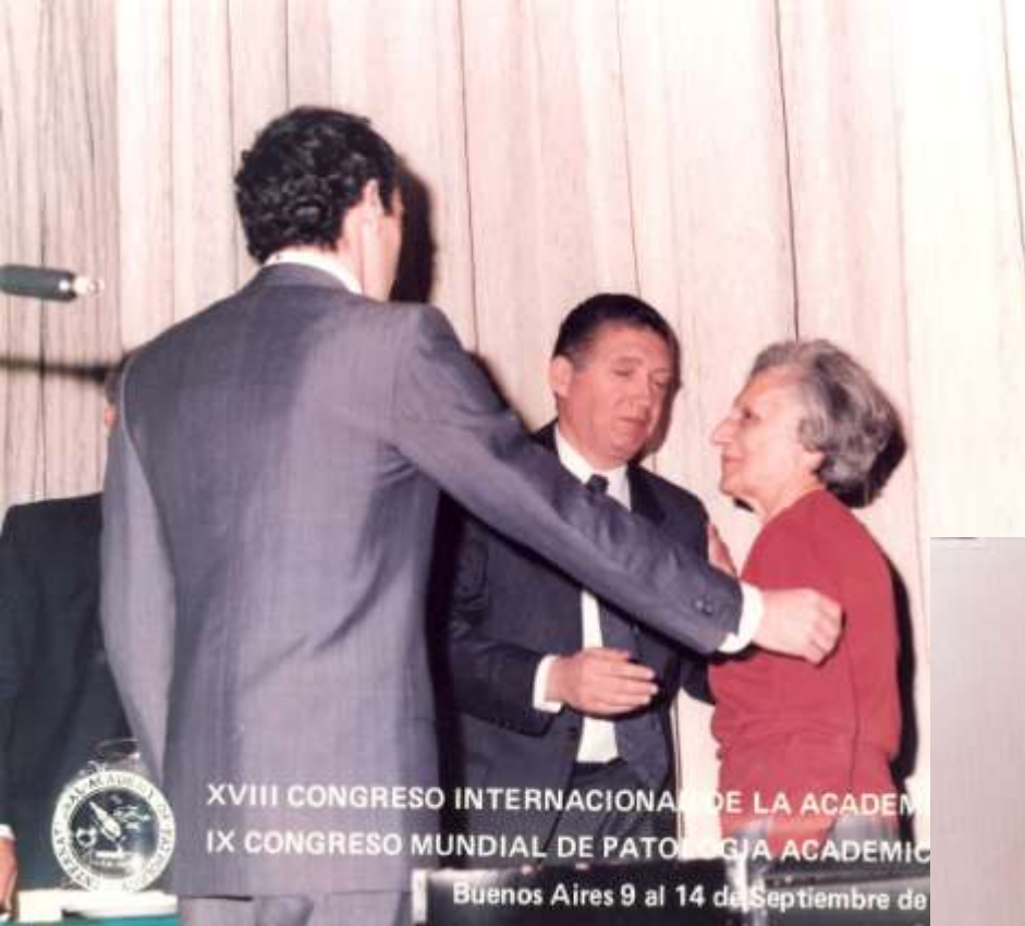
XVIII CONGRESO INTERNACIONAL DE LA ACADEMIA INT. DE PATOLOGIA IX CONGRESO MUNDIAL DE PATOLOGIA ACADEMICA Y MEDIO AMBIENTE Buenos Aires 9 al 14 de Septiembre de 1990