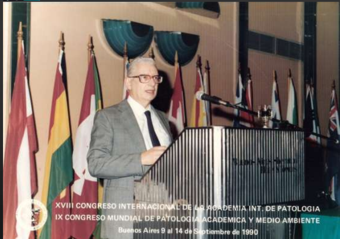
XVIII CONGRESO INTERNACIONAL DE LA ACADEMIA INT. DE PATOLOGIA IX CONGRESO MUNDIAL DE PATOLOGIA ACADEMICA Y MEDIO AMBIENTE Buenos Aires 9 al 14 de Septiembre de 1990