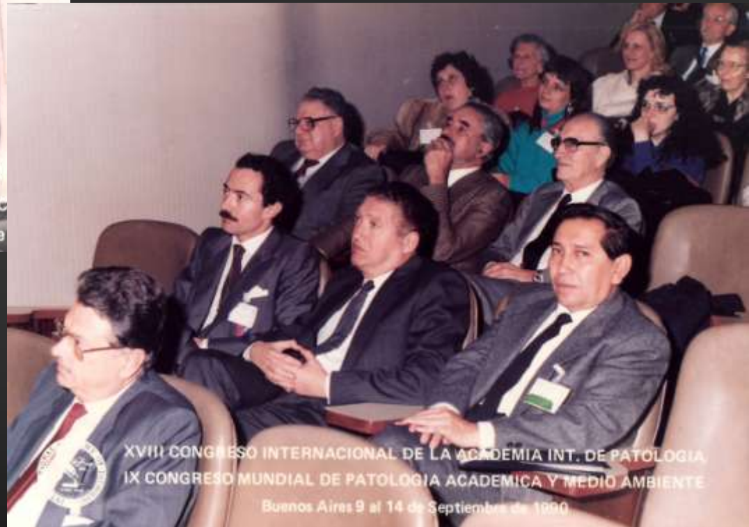
XVIII CONGRESO INTERNACIONAL DE LA ACADEMIA INT. DE PATOLOGIA, IX CONGRESO MUNDIAL DE PATOLOGIA ACADEMICA Y MEDIO AMBIENTE Buenos Aires 9 al 14 de Septiembre de 1990