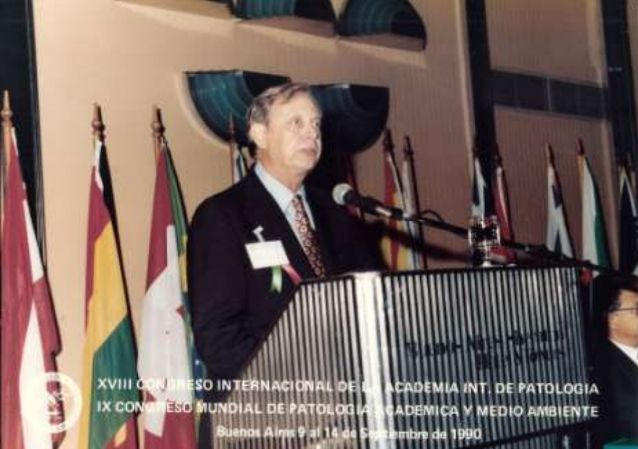
XVIII CONGRESO INTERNACIONAL DE LA ACADEMIA INT. DE PATOLOGIA IX CONGRESO MUNDIAL DE PATOLOGIA ACADEMICA Y MEDIO AMBIENTE Buenos Aires 9 al 14 de Septiembre de 1990